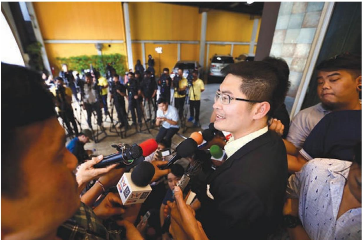
"พี่เต้ พระราม 7" มงคลกิตติ์ สุขสินธารานนท์ ก่อหวอด "เพื่อนพรรคเล็ก" ประกอบด้วย พรรคพลังไทยรักไทย พรรคประชาธิปไตยใหม่ พรรคประชารวมไทย และพรรคครูไทยเพื่อประชาชน ประกาศ "ทบทวน" การร่วมรัฐบาล หลัง "สัญญาใจ" เรื่องเก้าอี้ "ข้าราชการการเมือง" โดนเบียด

เมื่อความชัดเจนปรากฏ ทำให้ฝุ่นควันใน "พรรคพลังประชารัฐ" สงบลงไปพอสมควร ด้วยแคนดิเดต "สตาร์ฟ รมต." ถูกตัดไปด้วยเหตุผลทางกฎหมาย พร้อมกับมีแนวนโยบายว่า ตำแหน่งต่างๆ เหล่าจะจัดสรรให้กับ "อดีตผู้สมัคร-ทีมหาเสียง" ที่ลงแรง